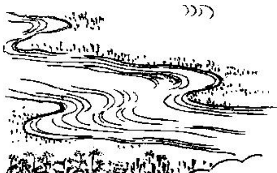
Фиг. 4. Психичното пространство според Джеймс

те модели на З. Фройд и К. Юнг, но намира поетичен израз в теорията на У. Джеймс. Най-естествените метафори, които могат да опишат съзнанието, са „река“ или „поток“. „Говорейки за него оттук нататък, нека го наречем поток на мисленето, на съзнанието, на субективния живот“ (Джеймс 2000а: 194).