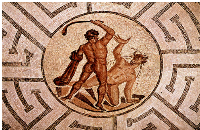
Фиг. 4. Лабиринтът на Тезей

Лабиринтът на Тезей (вж. фиг. 4) представя идеята за живота като пътуване през трудностите и илюзиите на света, като учене и себеосъществяване чрез преминаване през изпитанията.