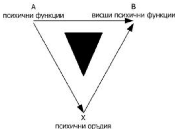
Фиг. 5. Тричленна схема на инструменталния акт

Метафората, която въвежда Л. Виготски, свързва световите на бихейвиористите и менталистите. Той представя психичното пространство чрез „смысловото поле“. Тази идея е представена в доклада „Инструменталният метод в психологията“ (Выготский, 1930), изнесен през 1930 г. Съзнанието не е само сцена, на която се явяват психичните функции. Виготски предлага смысловото поле за единица на психологическия анализ, носеща качествено своеобразие на съзнанието, и го представя чрез тричленната схема на инструменталния акт (вж. фиг. 5).