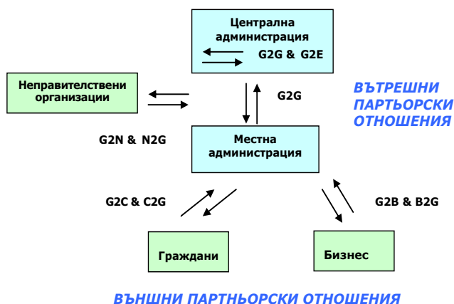
Фиг. 1. Обобщен модел на електронно правителство 3

3) Администрация – администрация – комуникация между отделните административни структури.