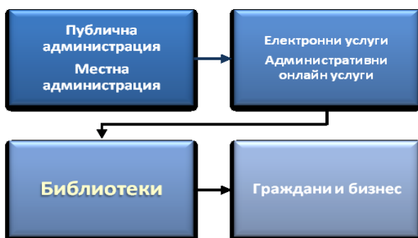
Фиг. 2. Ролята на библиотеките в електронното правителство

Библиотеките се явяват „свързващ елемент“, посредник в процеса на комуникация между гражданите и държавната администрация (фиг. 2). и са важен фактор за развитието на електронното правителство. От една страна, като обществени центрове за достъп до информация за всички 12 те предоставят безплатен достъп до компютри и интернет. От друга страна, предлагат информационно обслужване на потребителите с разнообразна информация (включително правителствена – административна информация) и услуги по електронен път – библиографска справка, доставка на документи, достъп до електронен каталог (една от услугите на електронното правителство). Не на последно място, библиотеките имат възможността да провеждат обучение на потребителите за работа с информационни и комуникационни технологии, издирване на информация по различни теми и използване на различни информационни услуги онлайн.